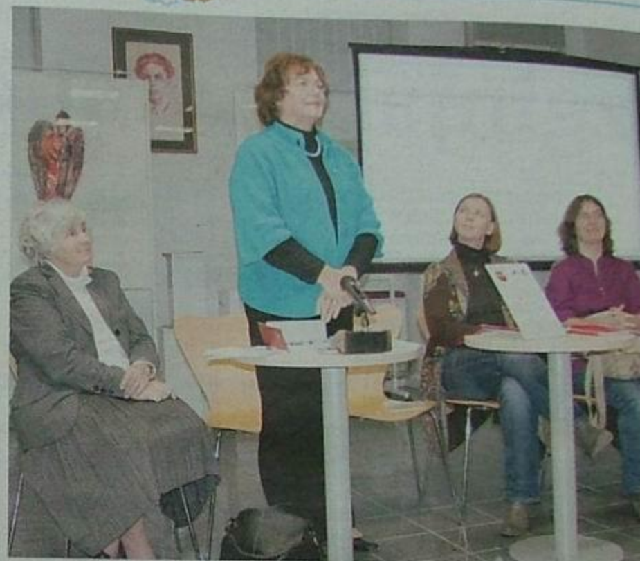
Tudi v Sežani so ustanovili univerzo za tretje življenjsko obdobje